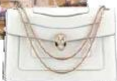
Сумка Dream Bags от Viviani, Galeries Lafayette (Париж)