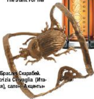
Браслет Скарабей, Patrizia Corvaglia (Италия), салон «Акцентъ»