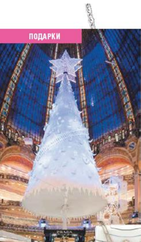
Елка из бумаги в Galeries Lafayette (Париж)

Получать подарки любят все, но их выбор порой доставляет немало хлопот. Избавяем вас от мучительных поисков и с радостью делимся вдохновляющими идеями. В нашей подборке – всё самое праздничное, красивое и стильное.