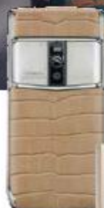
Телефон Vertu Signature Touch Alligator