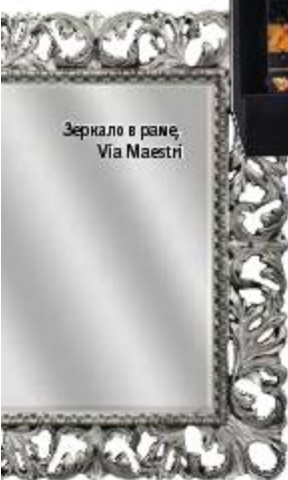
Зеркало в раме, Via Maestri