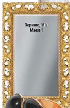
Зеркало, Via Maestri