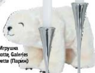
Игрушка Mascotte, Galeries Lafayette (Париж)