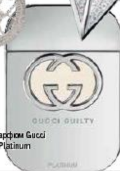
Мужской парфюм Gucci Guilty Platinum