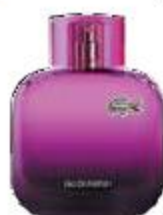
Мужская туалетная вода Magnetic, Lacoste