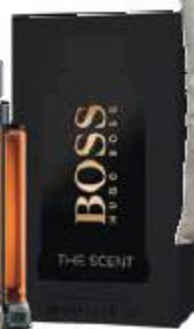
Мужской парфюм Boss The Scent