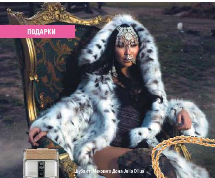
Шуба от мехового Дома Julia Diluz