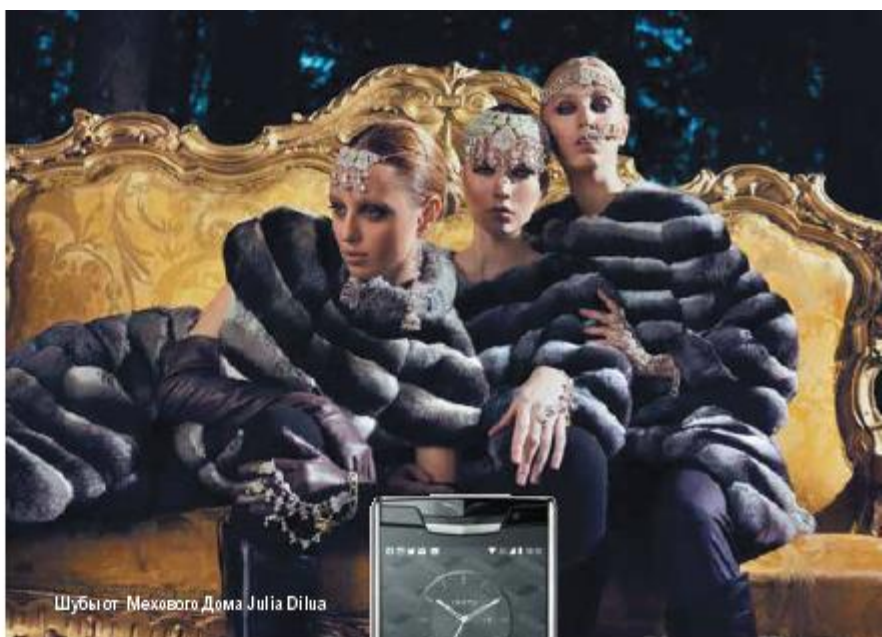
Шубы от мехового Дома Julia Dilva