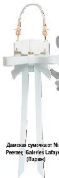
Дамская сумочка от Niels Reegaer, Galeries Lafayette (Париж)