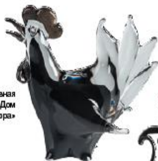
Декоративная фигурка петуха, «Дом Фарфора»