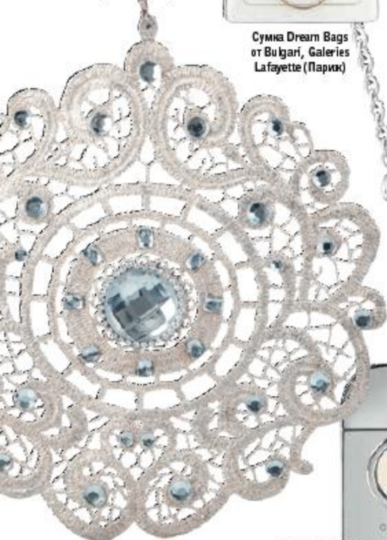
Елочное украшение «Дом Фарфора»