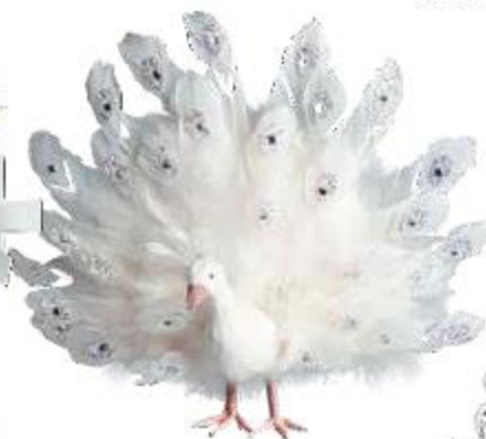
Декоративный белый павлин, «Дом Фарфора»