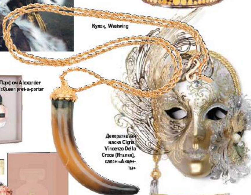
Декоративная маска Sigis, Vincenzo Della Croce (Италия), салон «Акцентъ»