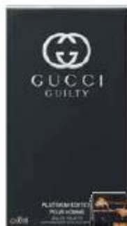
Мужской парфюм Gucci Guilty Platinum