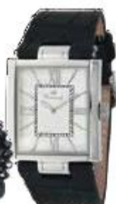
Мужские часы, Westwing