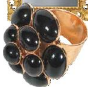
Кольцо Camelia, Philippe Ferrandis (Франция), салон «Акцентъ»