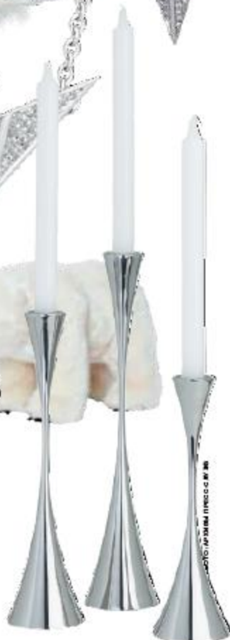
Набор из 3 подсвечников, Crate and Barrel