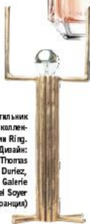
Светильник из коллекции Ring. Дизайн: Thomas Duriez, Galerie Attel Soyer (Франция)