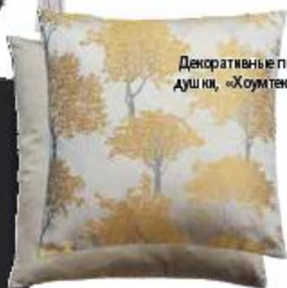
Декоративные подушки, «Хомтекс»