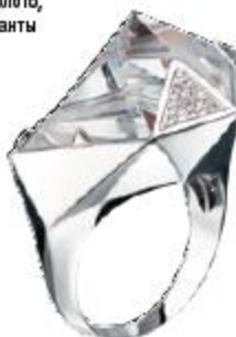
Перстень Iceberg от Carrera у Carrera. Белое золото, хрусталь, бриллианты