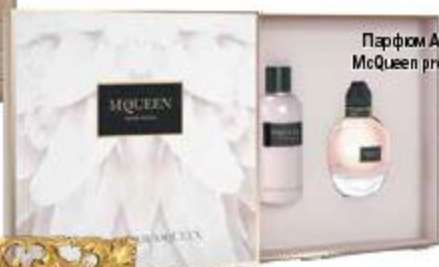
Перфюм Alexander McQueen pret-a-porter