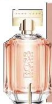
Женский парфюм Boss The Scent For Her