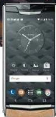
Телефон Vertu Signature Touch Almond Alligator