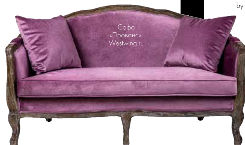
Софа «Прованс», Westwing.ru