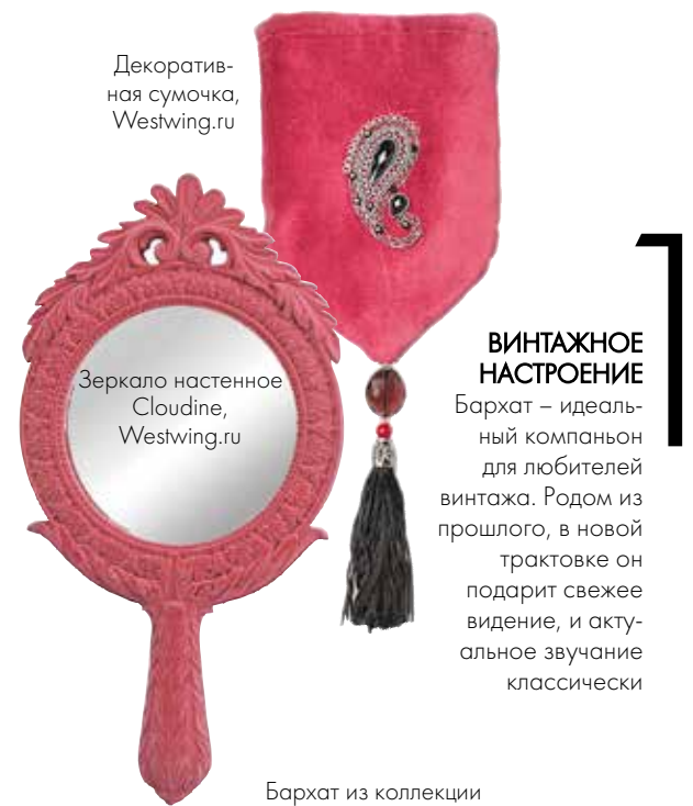
Декоративная сумочка, Westwing.ru