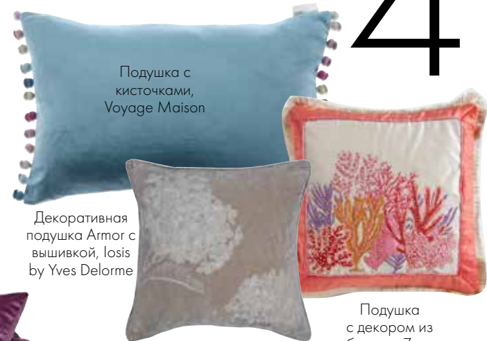
Подушка с кисточками, Voyage Maison

ТЕПЛЫЙ ПРИЕМ Выбираете ли вы оббивку дивана, роскошное покрывало, этнические подушки или ковер... в бархате они будут дарить нежные прикосновения и абсолютный комфорт каждый день