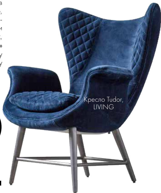
Кресло Tudor, LIVING

СНОВА В МОДЕ Бархат вернулся и занял первые строки хит-парада. Стряхнув с себя пыль прошлого, он стал доступен в самых модных оттенках и современных формах, которые будут «к лицу» буквально любому интерьеру