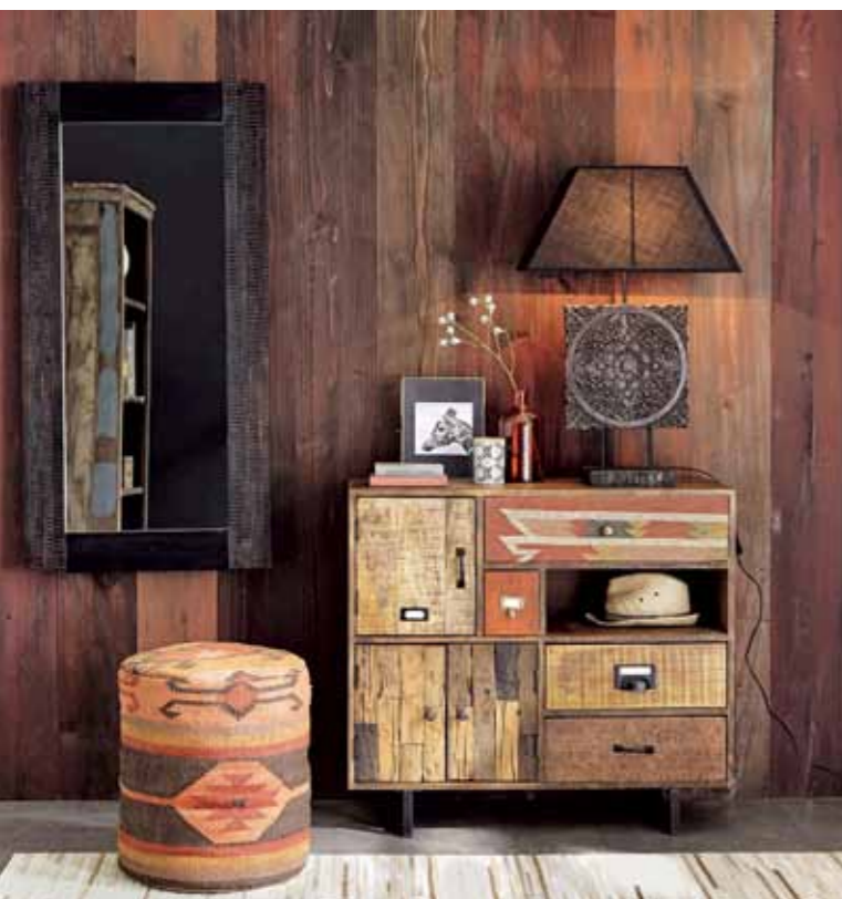
▲ ШЕДЕВР! Кожа, ткань и даже старые переработанные железнодорожные шпалы соединились в этом необычном комод. Смелое решение для интерьера с уклоном в стиль вестерн (Maisons du Monde).

► ХАРАКТЕР КОВБОЯ Деревянная мебель, кожаный диван, столик из бетона — все лаконично и просто, никаких элементов роскоши, но вместе с тем невероятно стильно (интерьер La Redoute).