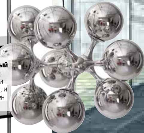
Хромированный светильник Westwing.ru и футуристичен, и функционален