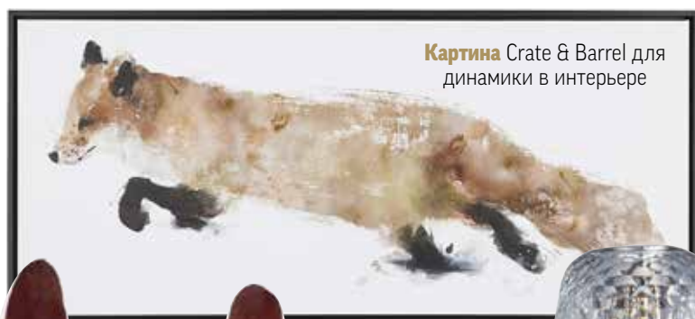
Картина Crate & Barrel для динамики в интерьере