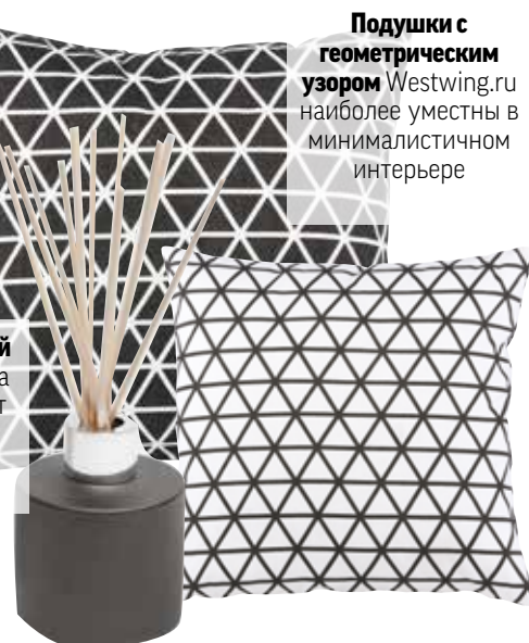
Подушки с геометрическим узором Westwing.ru наиболее уместны в минималистичном интерьере