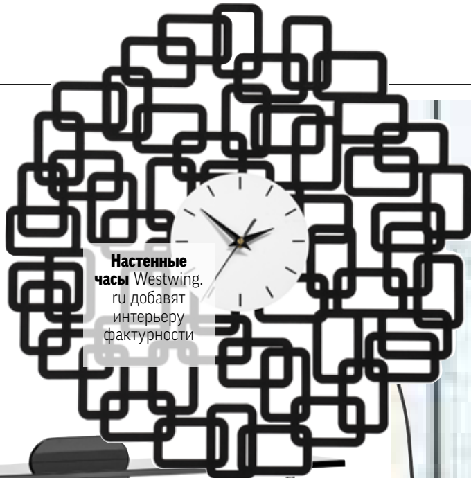
Настенные часы Westwing.ru добавят интерьеру фактурности