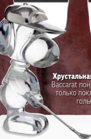
Хрустальная фигурка Вассарат понравится не только поклонникам гольфа